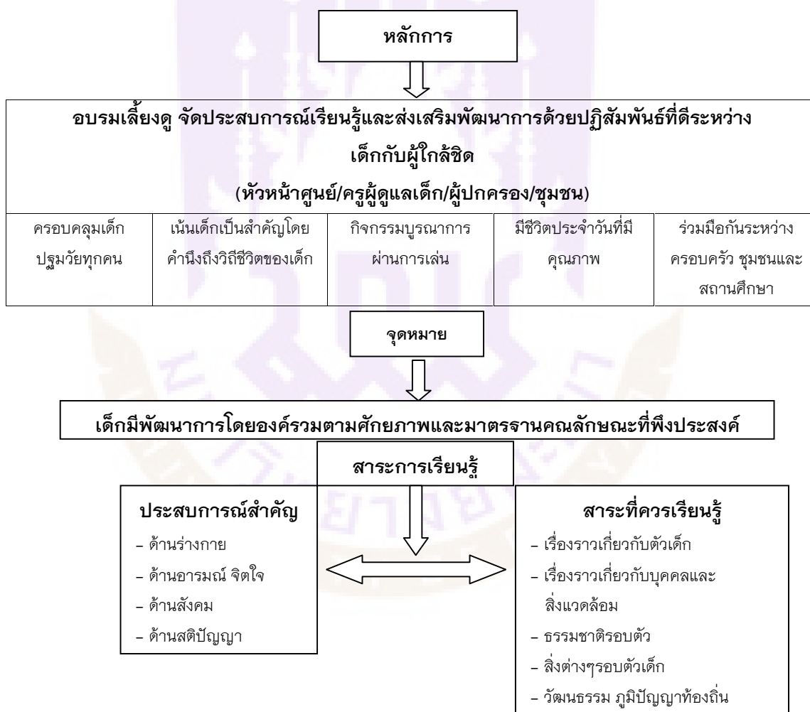
ภาพ 1 แสดงการจัดการศึกษาปฐมวัย